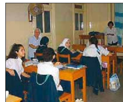
Niñas en una escuela egipcia.

En muchas ocasiones, estos aspectos vienen modelados por la influencia de la legislación, pero en otros son la religión, la educación o, simplemente, la tradición, los que imponen sus reglas, manteniendo los principios de autoridad, jerarquía y sumisión de leyes patriarcales ancestrales. Estas normas son entendidas por mu-