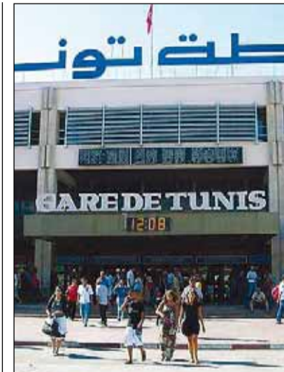
Estación central de Túnez.