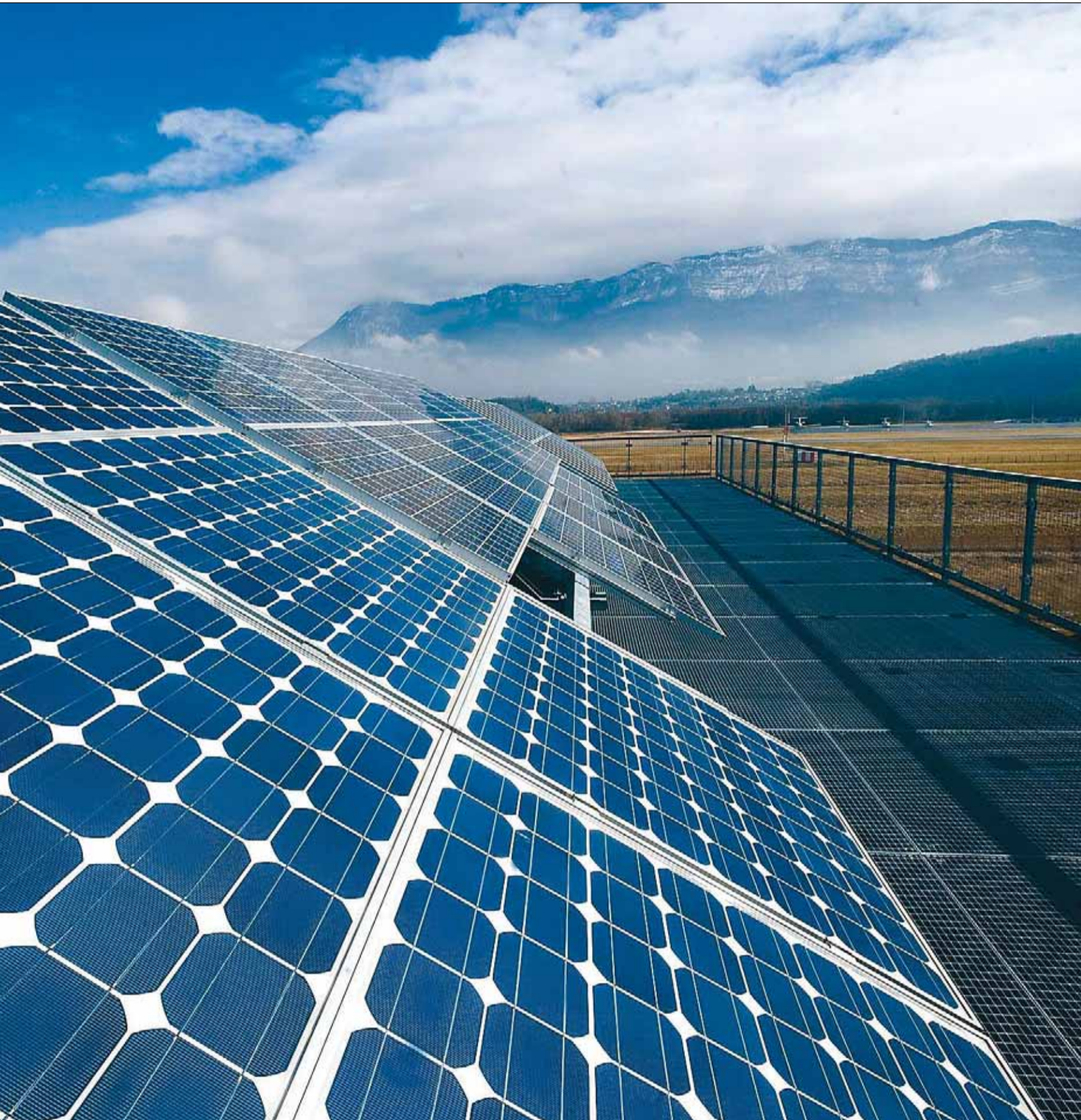
de la energía solar.