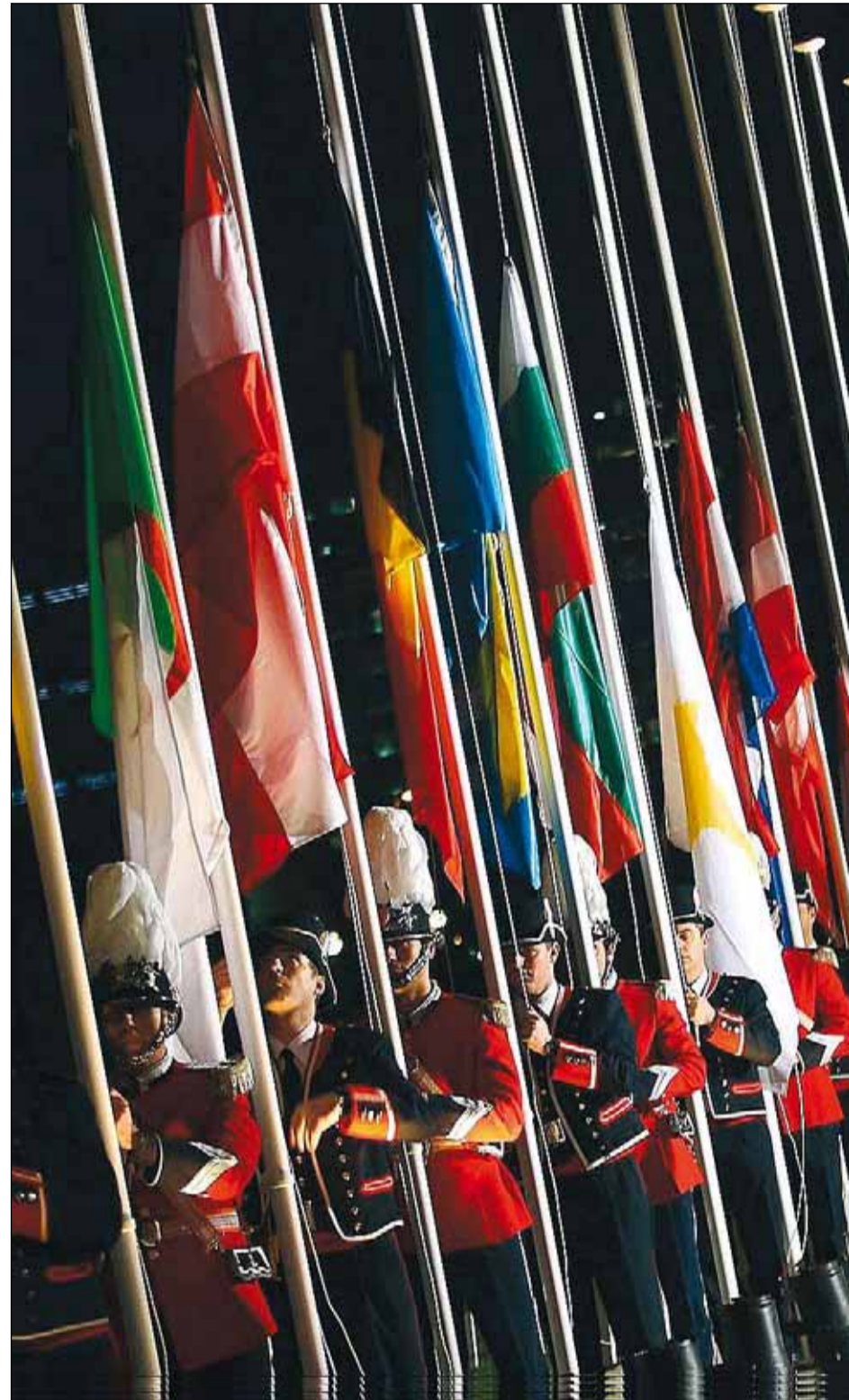
lizada de banderas durante la inauguración de la sede de la Secretaría de la Unión por el