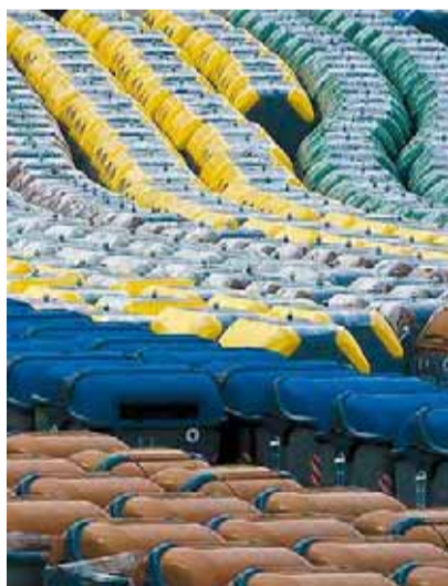
Contenedores de recogida selectiva.