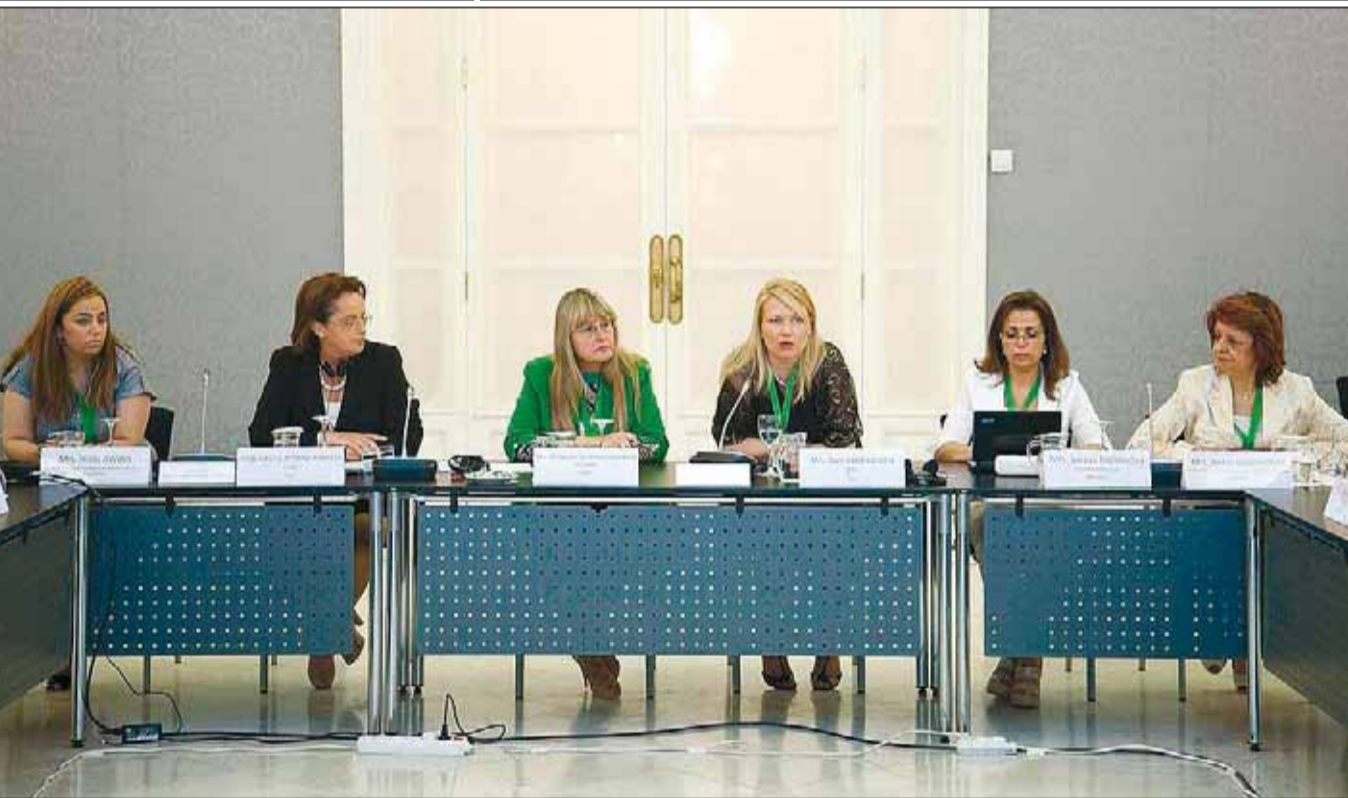
la derecha y abajo a la izquierda, varias emprendedoras. Abajo a la derecha, mujeres del Anima Investment Network.

de marzo la comisaria de Justicia y Derechos Fundamentales de la Comisión Europea, Viviane Reding”.