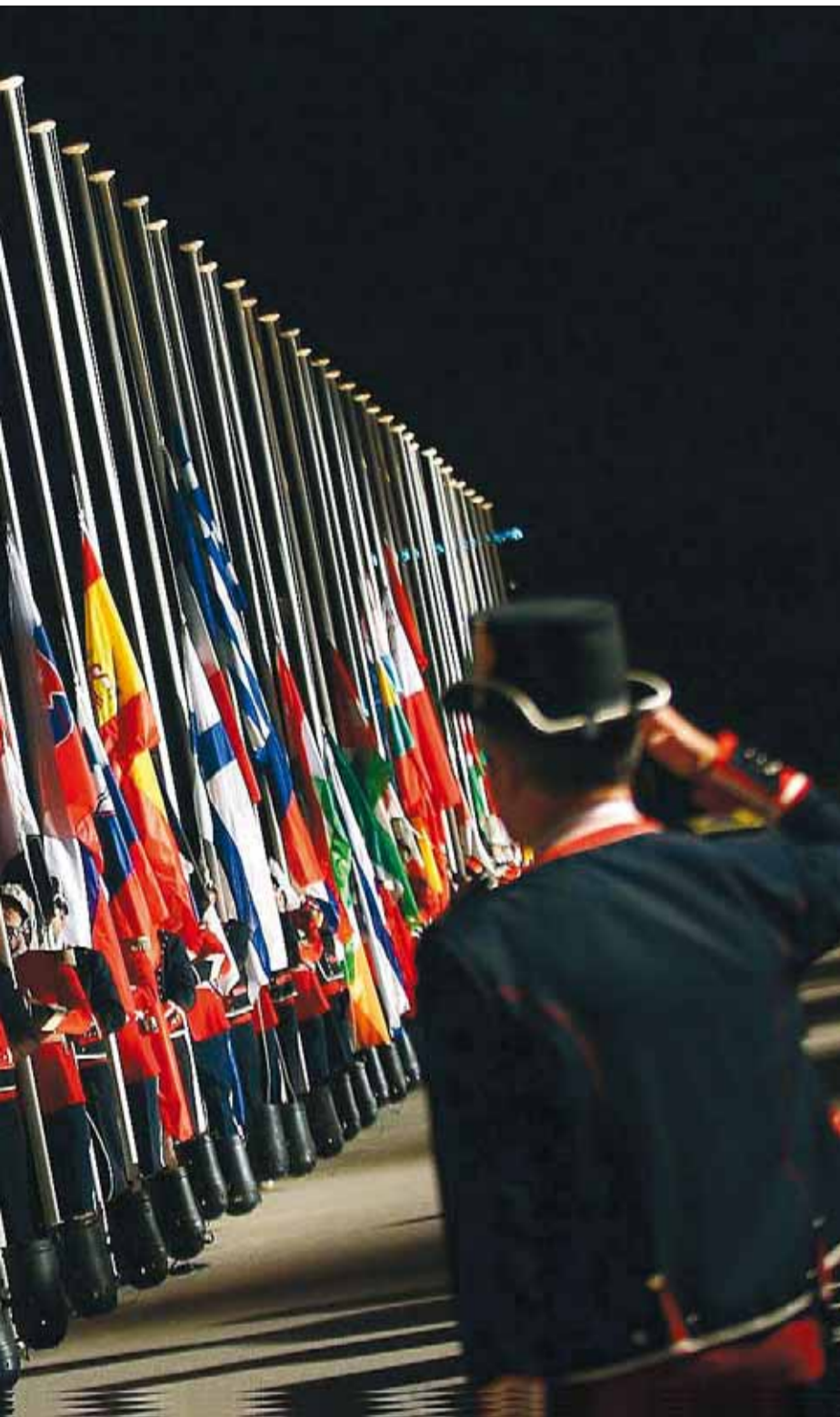
Mediterráneo en el palacio de Pedralbes en marzo del 2010.