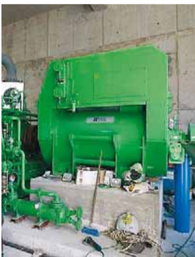
Caldera en una planta de reciclaje.