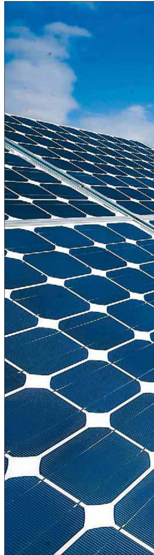
Modelo de instalación para el aprovechamiento

Los ponentes del foro plantearán la necesidad de que los gobiernos actúen para crear un entorno de negocios eficiente y regulado de manera equitativa. La perspectiva no es halagüeña dado que la competencia para los volúmenes limitados de capital que están disponibles se prevé dura e intensa. En cualquier caso los países del norte de África no pueden escapar a este dilema si quieren estimular la diversificación económica y el crecimiento de