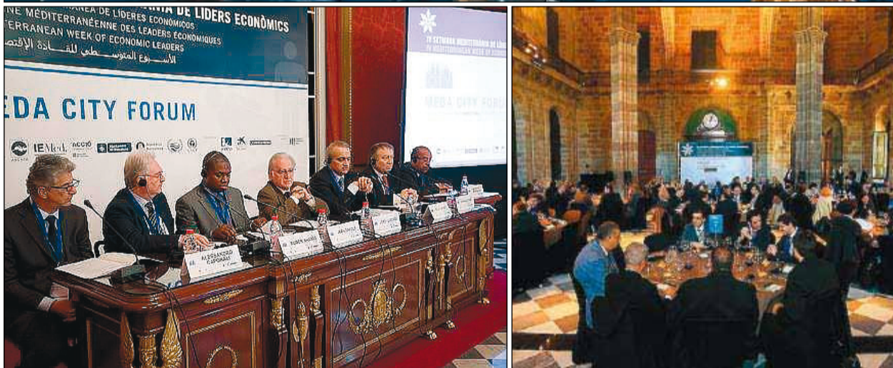
Varios momentos de la última edición de la Semana Mediterránea de Líderes Económicos.

riado permanente como un agente de desarrollo económico y progreso, pero también consolida a Barcelona como capital económica del Mediterráneo.