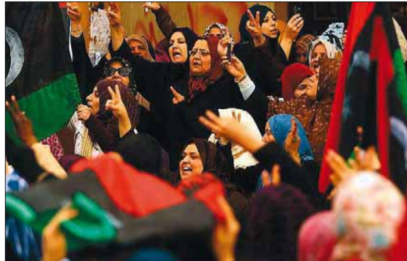
Viernes de oración en la plaza de la Revolución.

Además, concluye la ponente, “la emprendeduría encaja bien con la vida de las mujeres, dándoles flexibilidad para conciliar la vida privada y profesional, sobre todo en lo referente al tiempo y el lugar de trabajo”. ☉