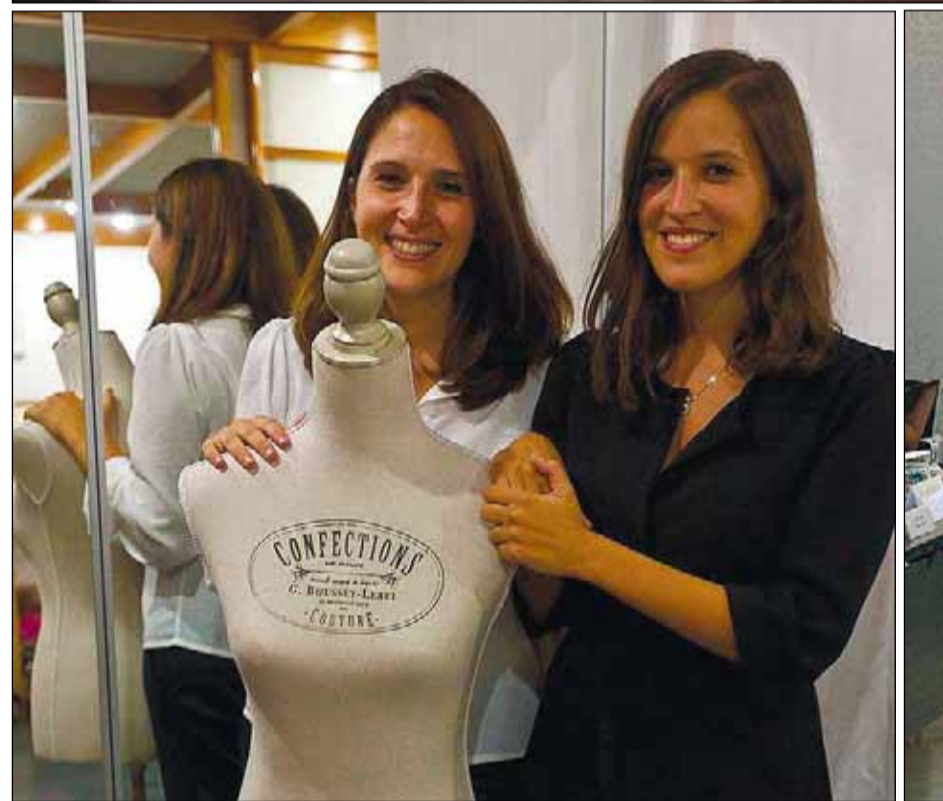
Arriba a la izquierda, participantes en el Meda Women Entrepreneurs Forum del 2009. Arriba a