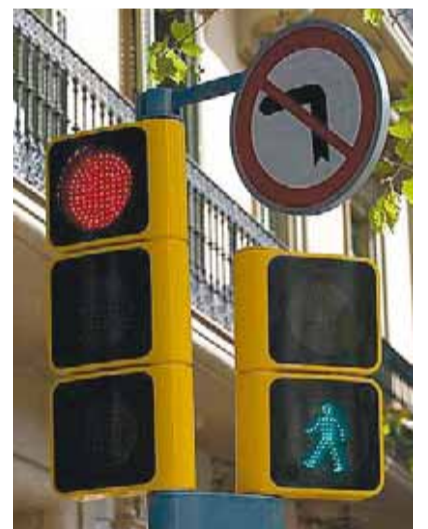
Semáforos con leds en Barcelona.

Existen tecnologías de bajo coste y esto supone una oportunidad para los paí-