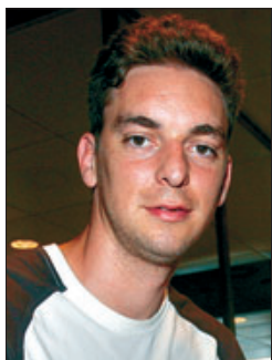
► Pau Gasol (2001).