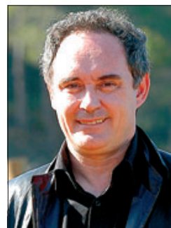
► Ferran Adrià (2003).